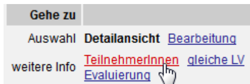
Abb. „TeilnehmerInnen“ auswählen