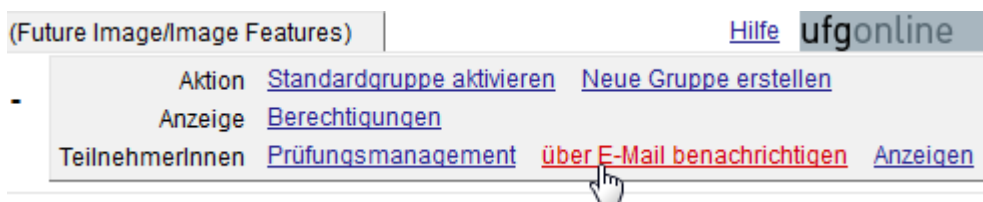
Abb. „über E-Mail benachrichtigen“ ...